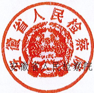
安徽省人民检察院