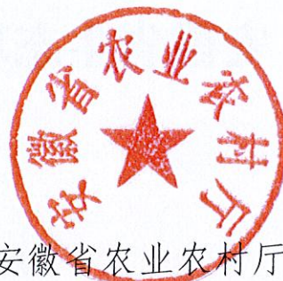
安徽省农业农村厅