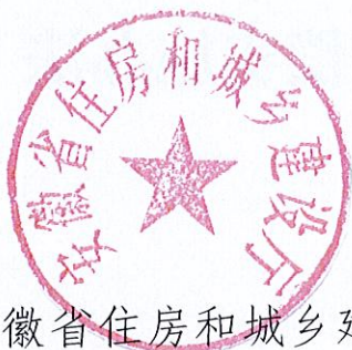
安徽省住房和城乡建设厅