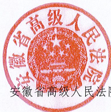
安徽省高级人民法院