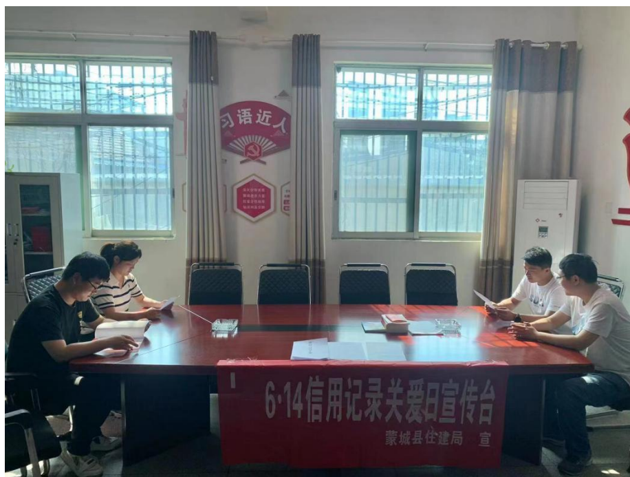
(蒙城建筑业企业协会宣传点)